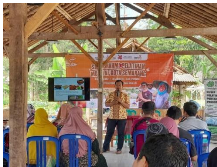
Gambar 1. Sosialisasi dan Perencanaan Kegiatan

Tim dosen Universitas Muhammadiyah Semarang memperoleh permintaan dari Lazizmu Kota Semarang untuk mendukung pemanfaatan lahan pekarangan guna meningkatkan produksi sayuran yang menjadi cikal bakal dimulainya kegiatan pengabdian ini. Program ketahanan pangan berbasis urban farming yang dijalankan oleh Pemerintah Kota Semarang juga didukung oleh kegiatan ini. Empat (4) kegiatan yang berbeda ditentukan setelah melakukan diskusi dan persiapan kegiatan dengan Lazizmu Semarang, Bertani Agrofarm, dan tim pengabdian (Gambar 1). Pembuatan media tanam, perawatan dan penataan kebun, memasukkan sayuran ke dalam polibag, dan pemanenan merupakan bagian dari rangkaian kegiatan tersebut.