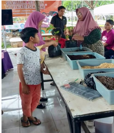
Gambar 3. Penataan Persiapan Lahan Tanam

Persiapan lahan kebun sayuran dimulai dengan membersihkan atau menyiapkan lahan, dan prosedur penanaman dan pemeliharaan dilakukan pada minggu berikutnya. Pemeliharaan lahan pertanian sayuran adalah tujuan utama dari program pengabdian ini. Meningkatkan ketahanan pangan rumah tangga adalah tujuan utama dari perancangan hingga pengelolaan kebun sayur ini. Agar sesuai dengan kebutuhan keluarga, tanaman yang dapat dimakan oleh masyarakat ditanam di pekarangan sebagai sayuran (Daryanti et al., 2023). Di pekarangan rumah, menanam sayuran sudah menjadi hal yang lumrah dilakukan oleh berbagai kelas sosial, masyarakat umum, Tim Penggerak PKK, dan KWT.