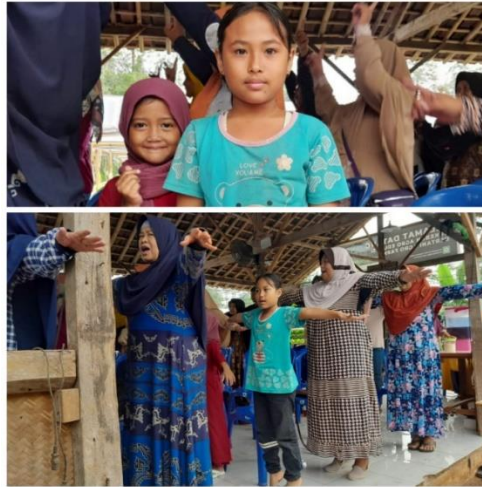
Gambar 4. Pendampingan dan Monitoring

menanam tanaman sayuran di Kabupaten Tabanan, Provinsi Bali, menunjukkan bahwa hal tersebut dapat berkontribusi pada pelestarian ketahanan pangan (Aini et al., 2020).