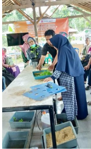
Gambar 2. Pendampingan Pembuatan Media Tanam

Salah satu aspek terpenting dalam budidaya tanaman yang mempengaruhi kuantitas dan kualitas tanaman adalah media tanam. Media tanam penting karena memasok air dan nutrisi yang dibutuhkan tanaman untuk tumbuh. Media tanam yang berkualitas tinggi akan menghasilkan pertumbuhan tanaman yang sehat, begitu pula sebaliknya. Kegiatan penting dalam produksi tanaman hortikultura adalah membuat media tanam (Daryanti et al., 2023; Sulistyono et al., 2022), terutama untuk tanaman sayuran, yang biasanya dikonsumsi langsung oleh masyarakat Kelurahan Mijen. Sejalan dengan proyek pengabdian masyarakat lainnya, budidaya sayuran memanfaatkan lahan kosong di sekitar Kelurahan Mijen (Afa et al., 2021).