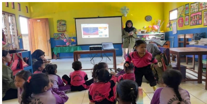
Gambar 3. Pemberian Edukasi melalui Sosialisasi

Sampah secara umum terbagi menjadi dua, yaitu sampah organik dan anorganik. Pertama, sampah organik yaitu limbah yang berasal dari sisa makhluk hidup seperti hewan, tumbuhan, dan manusia yang mengalami pelapukan atau pembusukan. Menurut Agus & Fajar (2015), jenis sampah ini termasuk sampah ramah lingkungan karena dapat diuraikan oleh bakteri secara alami dan berlangsung dengan cepat. Contohnya adalah kulit buah, daun kering, dan buah busuk. Kedua, sampah anorganik yaitu limbah yang berasal bukan dari makhluk hidup dan sulit terurai serta membutuhkan waktu yang lama untuk terurai. Contoh sampah anorganik adalah plastik, besi, dan kaca.