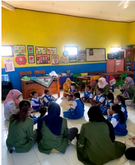
Gambar 5. Kegiatan Mengajar di TK Dharma Wanita 2

Upaya untuk meningkatkan kualitas pendidikan di Desa Musir Kidul juga dilakukan melalui kegiatan mengajar di TK Dharma Wanita 2. Hal ini dilakukan karena kurangnya jumlah tenaga pengajar yang tersedia di sekolah tersebut yang menyebabkan materi pembelajaran yang diberikan kurang efektif. Guru di TK Dharma Wanita 2 merasa senang dan mendukung kegiatan mengajar yang akan dilakukan di Taman Kanak-Kanak. Kegiatan mengajar mampu menambah pengetahuan dan wawasan bagi peserta didik.