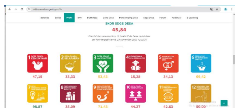
Gambar 1. Persentase Poin Pendidikan Desa Berkualitas Desa Musir Kidul Tahun 2024

Desa Musir Kidul yang terletak di Kecamatan Rejoso, Kabupaten Nganjuk mempunyai pendidikan yang dapat dikatakan belum berkualitas baik. Hal tersebut dapat dilihat melalui kondisi sekolah dan peserta didiknya. Permasalahan yang berkaitan dengan kualitas pendidikan di Desa Musir Kidul adalah seperti sarana dan prasarana yang belum memadai, kurangnya tenaga pengajar, dan kurangnya pengetahuan peserta didik baik mengenai akademis maupun non akademis. Maka dari itu, langkah atau upaya untuk mewujudkan pendidikan desa berkualitas di Desa Musir Kidul perlu untuk dilaksanakan. Berikut ini adalah persentase poin Pembangunan Berkelanjutan atau SDG's Desa Musir Kidul: