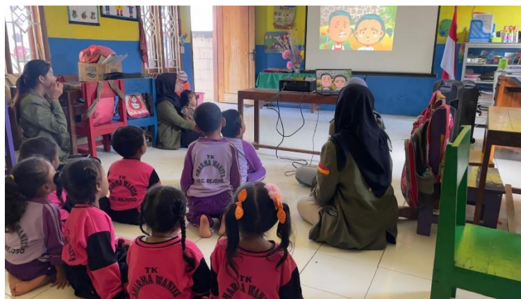
Gambar 4. Penayangan Video Ilustrasi

Pemberian edukasi melalui sosialisasi diselingi dengan penayangan video yang berupa gambar ilustrasi tentang gaya hidup zero waste . Terdapat video berupa dongeng yang bertemakan zero waste . Sebanyak 2 video ditayangkan pada kegiatan sosialisasi ini. Penayangan video dilakukan karena anak usia dini lebih tertarik pada aspek visual berupa gambar dibandingkan dengan tulisan. Mereka menyaksikan video dengan seksama.