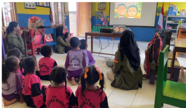
Gambar 4. Penayangan Video Ilustrasi

Pemberian edukasi melalui sosialisasi diselingi dengan penayangan video yang berupa gambar ilustrasi tentang gaya hidup zero waste . Terdapat video berupa dongeng yang bertemakan zero waste . Sebanyak 2 video ditayangkan pada kegiatan sosialisasi ini. Penayangan video dilakukan karena anak usia dini lebih tertarik pada aspek visual berupa gambar dibandingkan dengan tulisan. Mereka menyaksikan video dengan seksama.