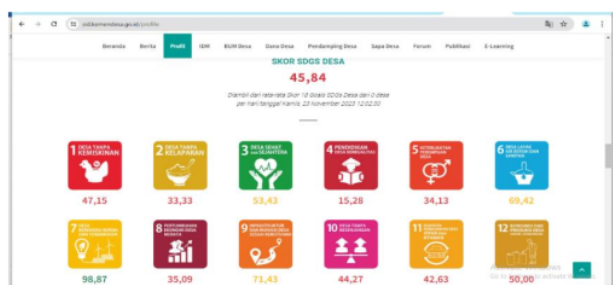
Gambar 1. Persentase Poin Pendidikan Desa Berkualitas Desa Musir Kidul Tahun 2024

Desa Musir Kidul yang terletak di Kecamatan Rejoso, Kabupaten Nganjuk mempunyai pendidikan yang dapat dikatakan belum berkualitas baik. Hal tersebut dapat dilihat melalui kondisi sekolah dan peserta didiknya. Permasalahan yang berkaitan dengan kualitas pendidikan di Desa Musir Kidul adalah seperti sarana dan prasarana yang belum memadai, kurangnya tenaga pengajar, dan kurangnya pengetahuan peserta didik baik mengenai akademis maupun non akademis. Maka dari itu, langkah atau upaya untuk mewujudkan pendidikan desa berkualitas di Desa Musir Kidul perlu untuk dilaksanakan. Berikut ini adalah persentase poin Pembangunan Berkelanjutan atau SDG's Desa Musir Kidul: