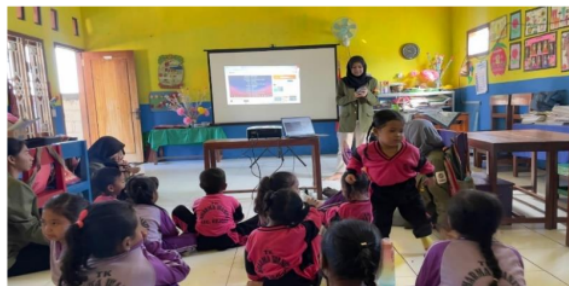
Gambar 3. Pemberian Edukasi melalui Sosialisasi

Sampah secara umum terbagi menjadi dua, yaitu sampah organik dan anorganik. Pertama, sampah organik yaitu limbah yang berasal dari sisa makhluk hidup seperti hewan, tumbuhan, dan manusia yang mengalami pelapukan atau pembusukan. Menurut Agus & Fajar (2015), jenis sampah ini termasuk sampah ramah lingkungan karena dapat diuraikan oleh bakteri secara alami dan berlangsung dengan cepat. Contohnya adalah kulit buah, daun kering, dan buah busuk. Kedua, sampah anorganik yaitu limbah yang berasal bukan dari makhluk hidup dan sulit terurai serta membutuhkan waktu yang lama untuk terurai. Contoh sampah anorganik adalah plastik, besi, dan kaca.