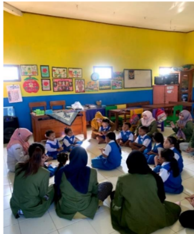
Gambar 5. Kegiatan Mengajar di TK Dharma Wanita 2