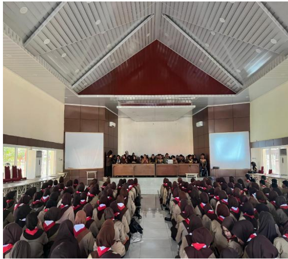
Gambar 1. Pemaparan Materi Sosialisasi.

peserta lebih mudah memahami isi materi.