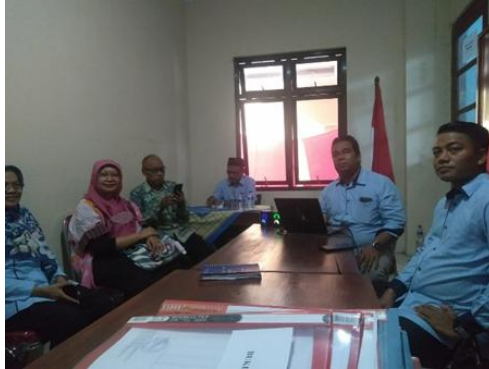
Gambar 1. Diskusi dengan desa, dinas PMK, dan BPKal Sumberadi