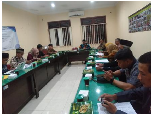
Gambar 3. Observasi dan Koordinasi dengan Perangkat Desa dan BPKal Sumberadi

Pelaksanaan kegiatan pengabdian kepada masyarakat yang dilakukan di Kalurahan Sumberadi Kapanewon Mlati Kabupaten Sleman Provinsi Yogyakarta bulan Maret sampai dengan Mei 2024. Permasalahan prioritas yang disurvei dari wawancara ke warga desa sumberadi dan observasi yang dilakukan bersama BPKal Sumberadi dan analisis kebutuhan yang mendesak. Agenda pelaksanaan selanjutnya yang dilakukan tim pengabdian yaitu merencanakan program dan implementasi program penggunaan website dan pengelolaan website bagi warga masyarakat sumberadi.