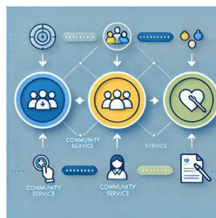
Gambar 2. Alur Kegiatan Pengabdian