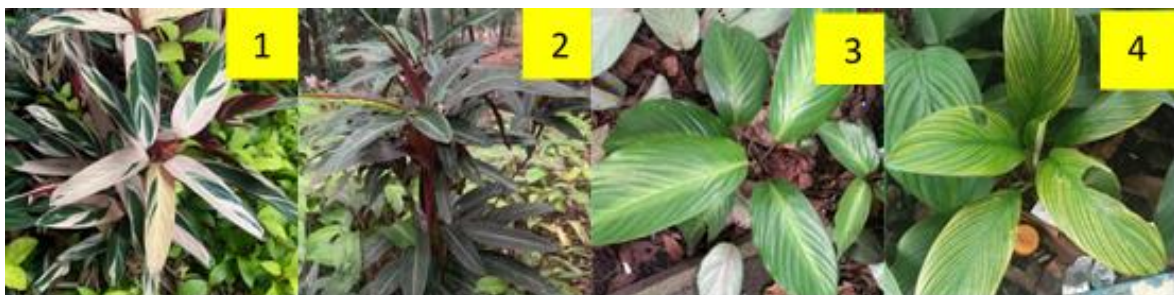
Gambar 3. 1) Stromanthe thalia , 2) Stromanthe sanguinea , 3) Goepertia brasiliensis , 4) Goepertia elliptica

Goepertia elliptica atau 'vitata', merupakan tanaman asli yang berasal dari Kolombia dan Guyana Prancis yang tergolong ke dalam genus Goepertia dan famili. Biasanya, spesies ini ditemukan di taman tropis kecil. Tanaman ini memiliki motif yang mencolok. Bentuk daunnya elips berwarna hijau sedang dengan corak garis-garis putih yang mengikuti urat daun lateral. Dengan motif yang mencolok, Goepertia elliptica cocok dijadikan sebagai tanaman hias.