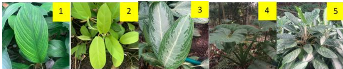
(Tabel 2). Gambar 2. 1) Spathiphyllum cannifolium (Dryand. ex Sims) Schott, 2) Aglaonema commutatum , 3) Xanthosoma sagittifolium , 4) Philodendron erubescens , 5) Aglaonema nitidum

Aglaonema nitidum Jack (kunth), merupakan tanaman hias daun dari suku talas. Tumbuhan ini mempunyai akar serabut dan batang tidak mempunyai kambium. Daun Aglaonema mempunyai ukuran yang besar, bentuk menyirip, dan pembuluh pembawanya acak. Tanaman ini, seperti Aglaonema commutatum schott , habitat pertamanya dari Asia Tenggara. Tanaman ini tumbuh secara alami di hutan hujan tropis. Tanaman Sri Rejeki membutuhkan intensitas cahaya rendah atau tempat yang teduh, kelembaban tinggi, dan suhu minimal 15 derajat Celcius di tempatnya pertama kali ditanam.