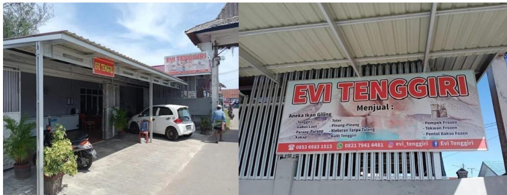
Gambar 2. Usaha Evi Tenggiri.

memanfaatkan hasil tangkapan ikan laut sebagai bahan baku utama. Usaha Evi Tenggiri dapat dilihat pada Gambar 2.